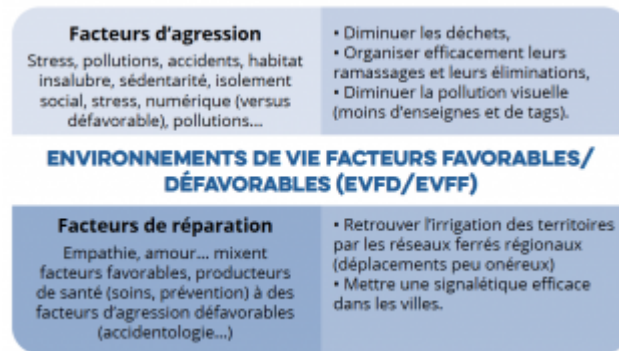
Figure 3 : Schéma d'après M De Spiegelare - C Cecchi « Environnements de vie - Débat avec les habitants d'une Métropole et suite... » Colloque CNFPT, Nancy, 2018

D'autres peuvent être des facteurs de réparation ou d'agression (Fig 3) comme l'insalubrité, les épidémies, la contamination... Ils relèvent souvent d'EDV individuels ou collectifs défavorables et sont parties prenantes dans le développement des maladies chroniques : obésité, pathologies respiratoires (tabac, pollution), cardio-vasculaires (sédentarité), stress, mal être, burn-out (conditions de travail, de vie difficiles). Les environnements sociétaux sont une des clés pour mieux appréhender les enjeux d'urbanisme et de santé.