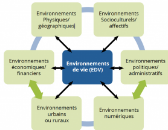
Figure 1 : Environnements de Vie. C Cecchi, Colloque « Ethique et santé publique, environnements de vie, santé, architecture ». Ensam Montpellier 2016

Les EDV (Fig 1) qu'ils soient numériques, politiques, urbains... interagissent les uns sur les autres et contribuent à créer des EDV favorables ou non à la santé.